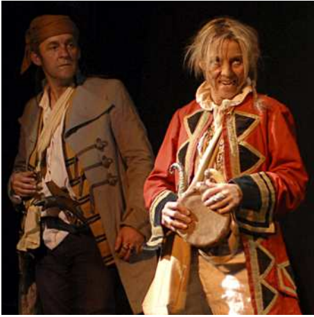
Le Cantique des Pirates