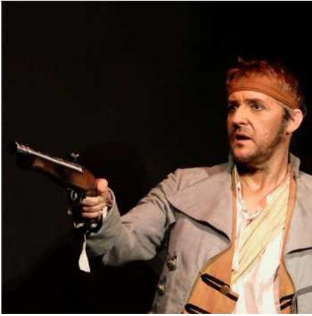
Le Cantique des Pirates