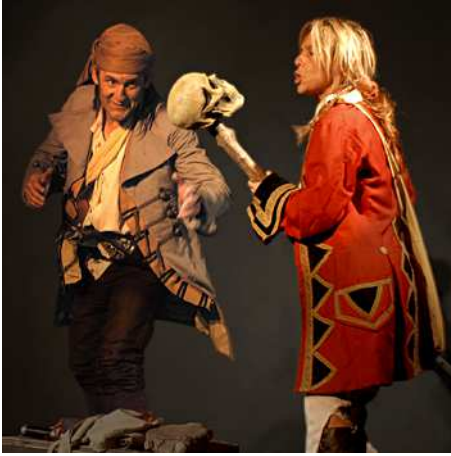
Le Cantique des Pirates